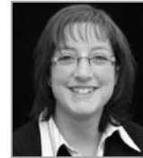
Andrea Günther Professional Services

Ihre telefonischen Fragen beantworten wir Ihnen gerne unter: 0 79 61 / 8 89 - 205